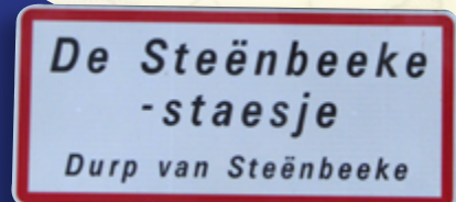
En waer is de Steënbeekestaesje ? Na Steënbeeke, voorzoekers !!! Et où est la gare de Steenbecque ? A Steenbecque bien sûr !!!