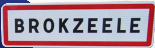
Brokzeele het nuu ze nieuwe ingangpaneels. Broxeele a maintenant ses nouveaux panneaux.