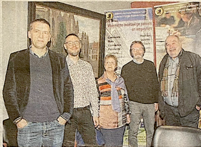
L'assemblée générale de l'institut a eu lieu le 22 avril.