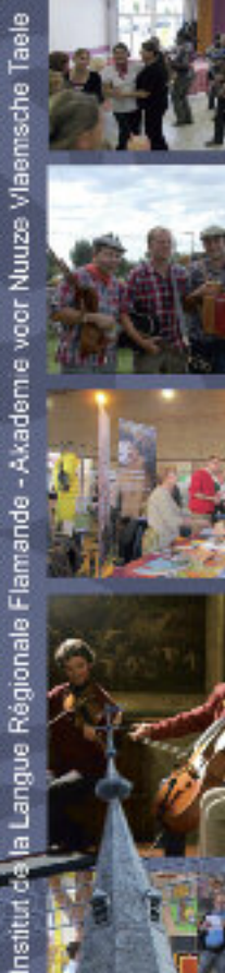
Institut de la Langue Régionale Flamande - Akademie voor Nuuze Vlaemsche Taele